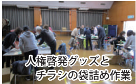
人権啓発グッズと チラシの袋詰め作業