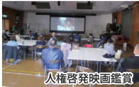
人権啓発映画鑑賞