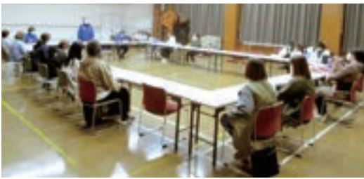
青少年定例講座(えいご・さんすう・英語) 日程表

受講生の保護者を対象に講師紹介、また講座日程や、受講時の注意事項、個人情報の取り扱い、スポーツ安全保険などについて説明し、今後のカレンダーを配布しました。