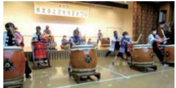
昨年度の夏まつりでのお披露目