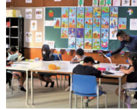
えいご教室 (小学生)