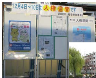
人権啓発パネルの展示