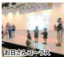
お日さんコーラス