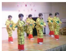
(写真は昨年度のもので)

■日時／3月24日(土) 14:00～16:00 ■場所／地域総合センター南武庫之荘 集会室／2階ロビー ■対象／どなたでも参加できます ■費用／無料