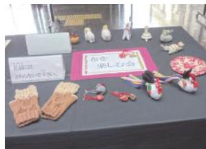
(写真は昨年度のもので)