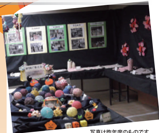
写真は昨年度のものです。

今年の秋まつりは新型コロナウイルス感染防止のため、人権交流フェスティバルやカラオケ大会、模擬店などを中止して、こどもたちや高齢者の作品展示を中心に開催します。毎年お楽しみにしていた方々には誠に残念ではありますが、何卒ご理解の上、今回の地域人権交流秋まつりを盛り上げていただきますようご協力をお願い申し上げます。