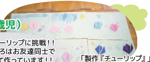
「製作『チューリップ』」

折り紙でチューリップに挑戦!! むずかしいところはお友達同士で 教え合ったりして作っています!!