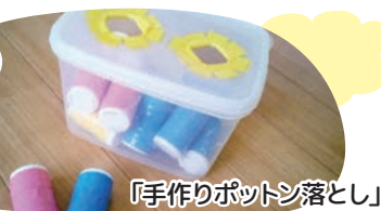
「手作りポットン落とし」