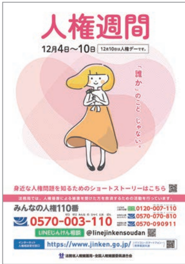
第76回 人権週間ポスター(法務省)

人権週間とは 世界人権デーは、世界人権宣言が1948年(昭和23年)12月10日に第3回国際連合総会で採択されたその日を記念して制定されました。わが国では毎年人権デーを最終日とする12月4日から12月10日までの1週間を人権週間とし、全国的に各種の啓発活動が行われています。