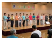
新婦人めだかコーラス