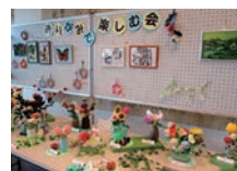
おりがみで楽しむ会